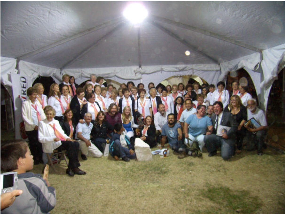
Acto de clausura del Encuentro