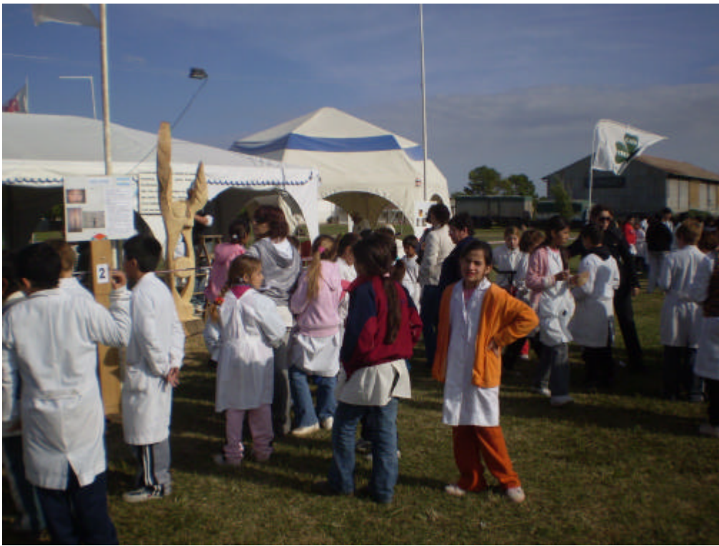
Alumnos de diferentes Establecimientos Educativos