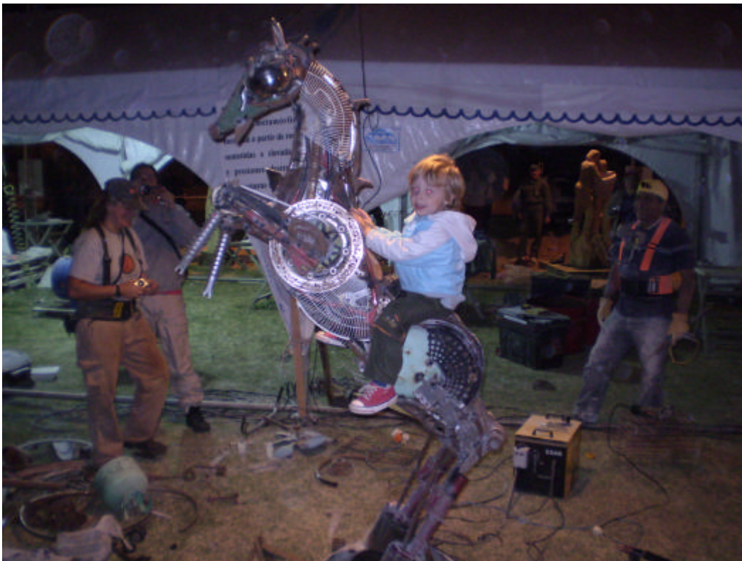
Los niños y el arte