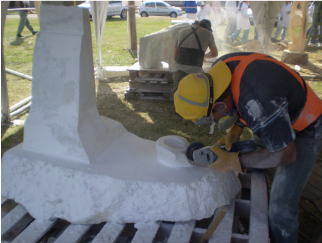
Escultor: Enrique Roncal Rodríguez