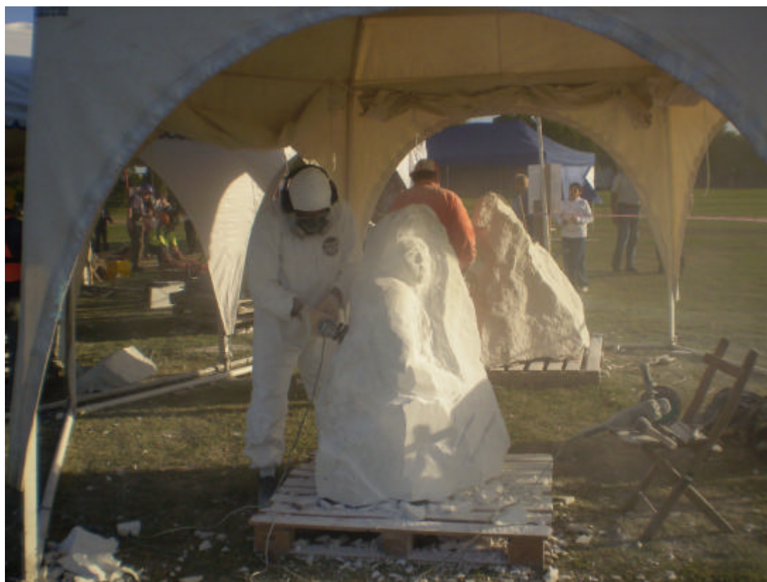
Escultor: Juan Carlos Mercurio